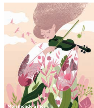
Mon monde à moi