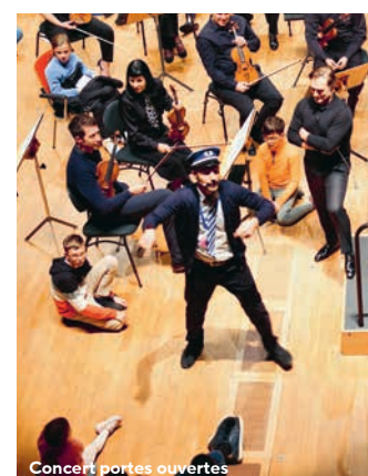
Concert portes ouvertes