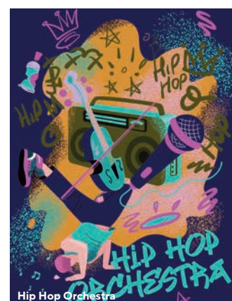
Hip Hop Orchestra